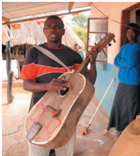
"Magic fingers" op 'n tuisgemaakte kitaar.