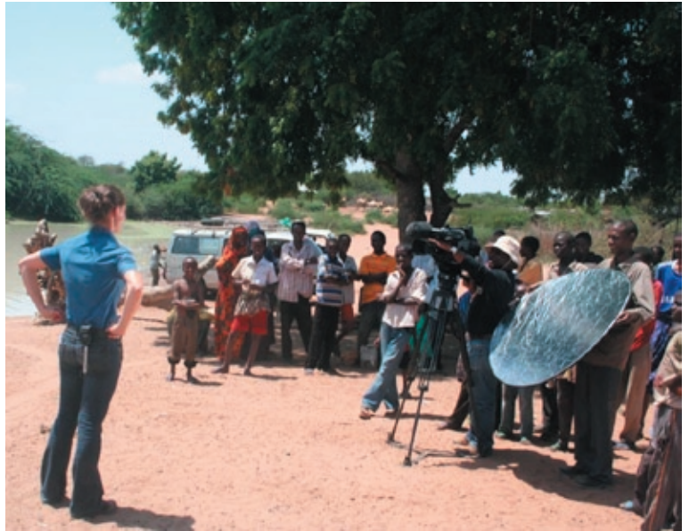
12:00 midday. Extremely hot (45 degrees). I must remember my words, keep my eyes open with the glaring sun and an audience looking on.

As a story teller, one never knows what awaits. As the camera starts rolling and you put pen to paper the potential of new worlds beckoning you closer awaits. It's the stuff dreams are made of. And as Truth reveals herself, one's own world is more often than not left changed forever. I doubt I can ever allow myself to live a conventional life; it's the kind of existence I will always be seeking, seeking refuge in a world more twisted and broken than anything I could ever have imagined.