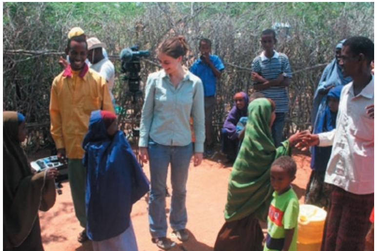
Surrounded by a number of Somali refugee children at one of Dadaab's watering points.