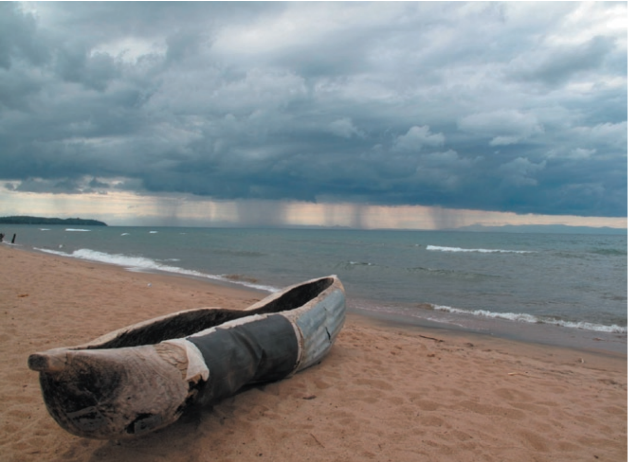
Betowerende Malawi