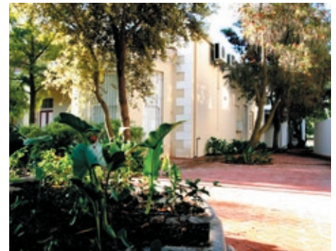
Foto bo en regs onder: Willem van der Berg. Foto regs bo: Vanessa Smeets - beide klas van 2010.